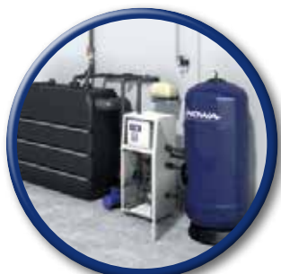
WATERTEC® WT 6