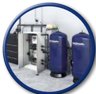
WATERTEC® WT 40