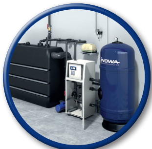
WATERTEC® WT 6