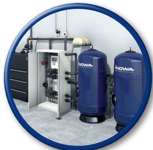
WATERTEC® WT 20